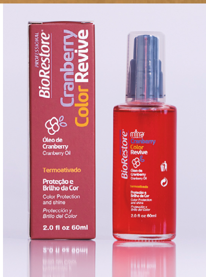
ÓLEO DE CRANBERRY: 60 ML