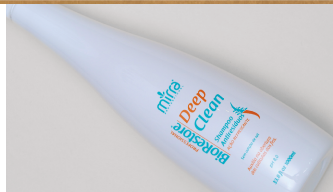
SHAMPOO 1000 ML