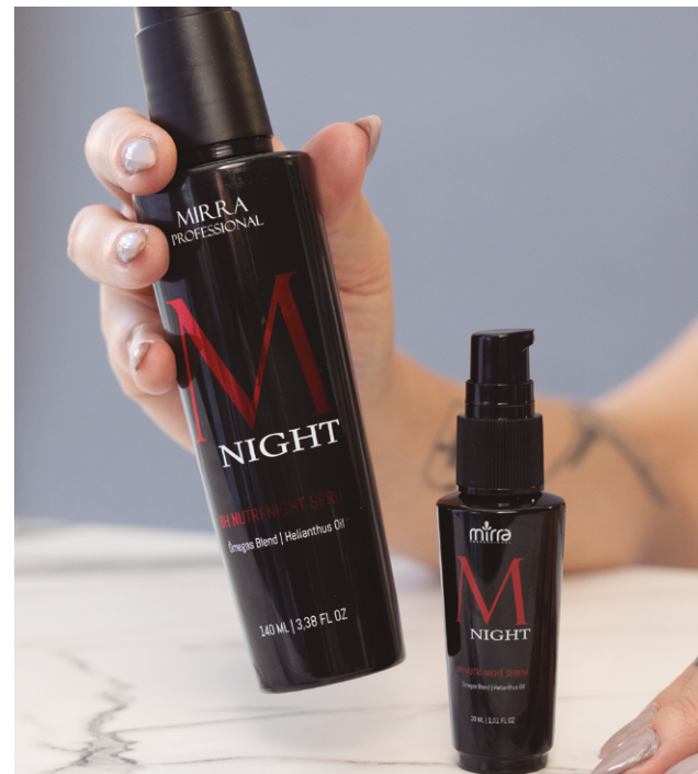
8H NIGHT SERUM: 140ML E 30 ML

Fonte de ÔMEGAS e HELIANTHUS OIL que promovem intensa nutrição noturna. A combinação de nutrientes naturais e óleos nobres promovem uma sensação e uma fragrância relaxante durante o sono. Sensorial leve e sedoso. Termoprotetor.