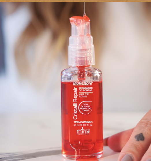
REPARADOR DE PONTAS: 30 ML