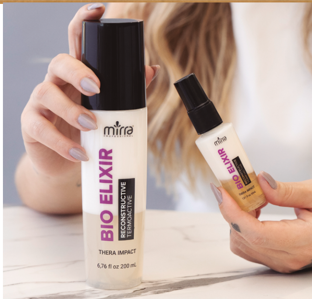
BIO ELIXIR: 200 ML E 30 ML