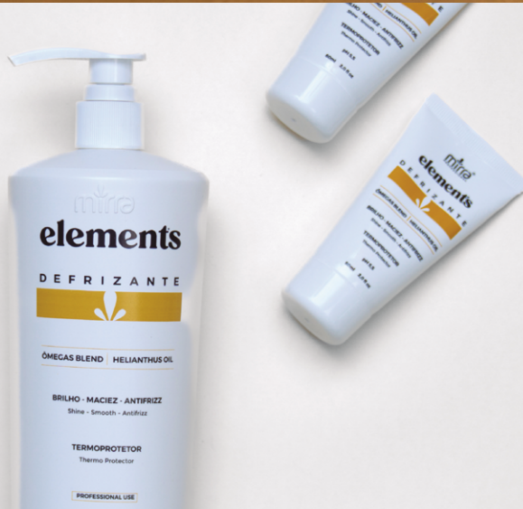
DEFRIZANTE ELEMENTS 1000 ML E 60ML