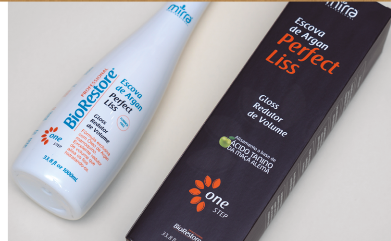
ESCOVA ARGAN: 1000 ML