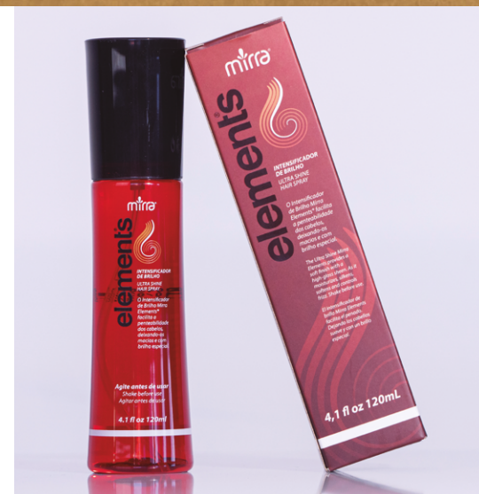
INTENSIFICADOR DE BRILHO: 120 ML

Possui vitaminas C e E. Sua fórmula é rica em agentes antioxidantes e filtros UVA/UVB que ajudam a proteger os fios dos raios solares e agentes agressores. A alta concentração de antioxidantes é excelente para proteger a cor dos cabelos. Termoativado.