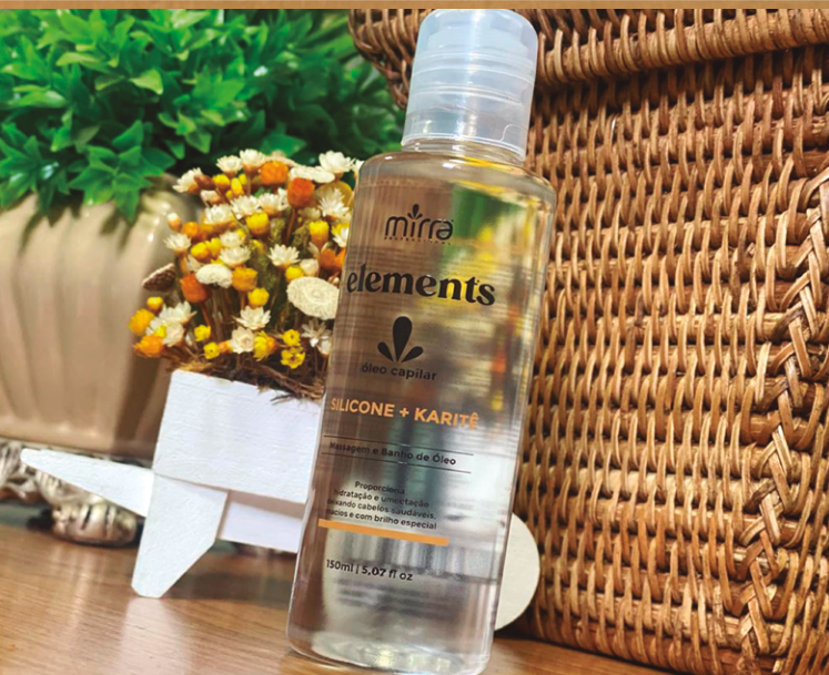
ÓLEO CAPILAR: 150 ML