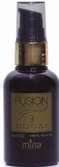
CREAMY OIL: 50 ML

O PASSO 3 da Linha FUSION CMC possui bionanotecnologia que age em todas as camadas da fibra capilar para proporcionar recuperação imediata além de aumentar a densidade do fio de cabelo.