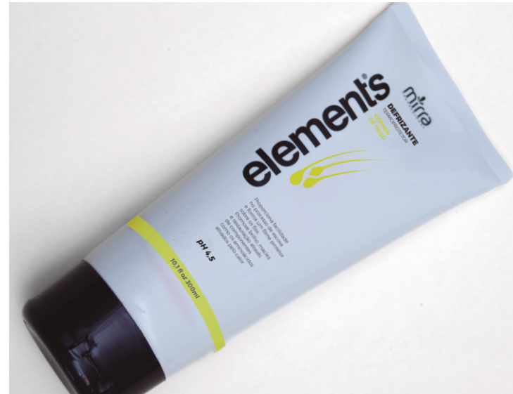
DEFRIZANTE ELEMENTS GÉRMEM DE TRIGO: 300 ML

O Defrizante Termoprotetor Gérmen de Trigo Elements proporciona facilidade no processo de escova e forma um filme protetor sobre os fios. Promove brilho, maciez e restauração através de componentes ativados pelo calor e pelos aminoácidos presentes em sua fórmula.